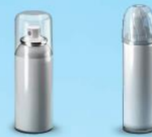
Spuitbussen voor voedingsmiddelen of cosmetica